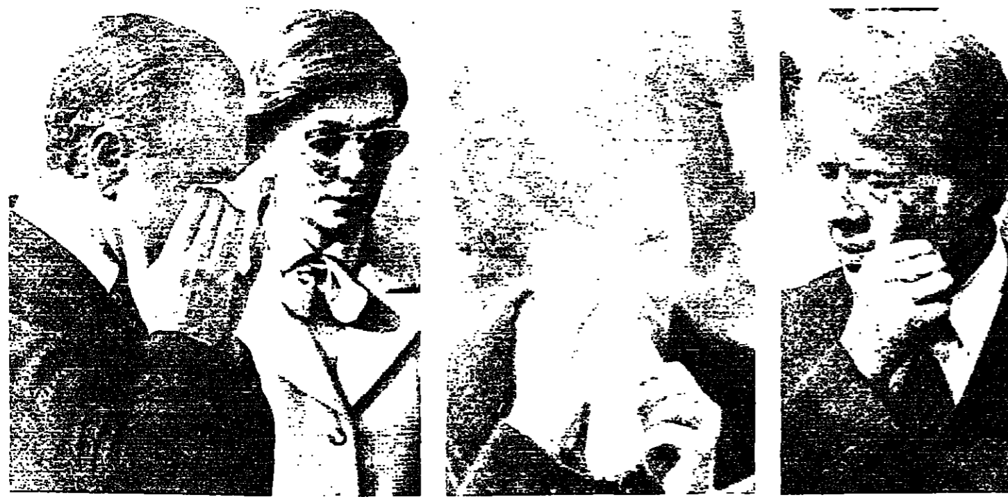
كارتر يسبح دعوه... وكذلك زوجته... الشاه يسبح عينيه والى جانبه الاميرة فرح

ويتميز تقدم الاساسي لم سعيد بنه طريق عام مزود الاتجاه طولها ٢٤ ميلاً بين المنطقة الصناعية والوحدة، بالإضافة الى تزويدها بالطاقة والمياه اللازمة لمعاملها، وتسهيلات اوسع شاملة مبنيتها، وبناء بلدة جديدة ذات اقتصاد ذاتي تام، وخطة البلدة الجديدة تصور توتجها شمالياً (تصنف قطري) يتكون من مزيج من المبنى المرتفعة والخضفة حول مركز تجاري متوسط يوسع كافة المرافق الترفيهية.